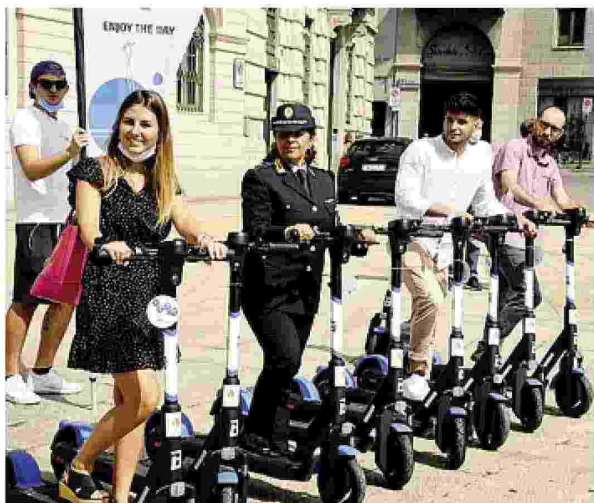
I nuovi monopattini arrivati ieri nelle vie della città